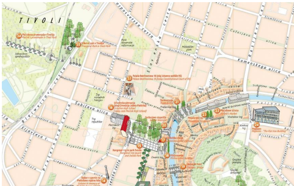
Primer karte »Plečnikova Ljubljana«.